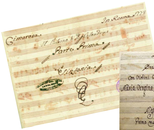
Partituren wie Bühnenabenteuer