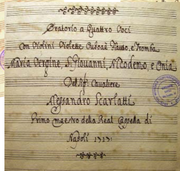
aus dem spätbarocken Neapel