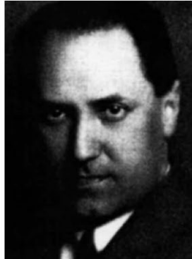
L. Weiner /H