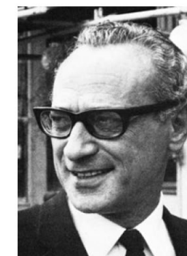
Haubenstock-Ramati /PL - A