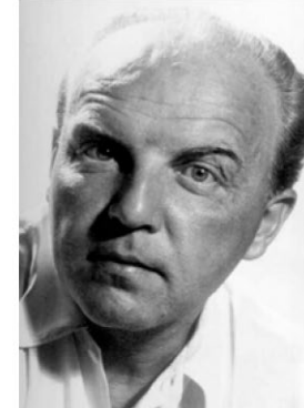
Krenek /A - USA