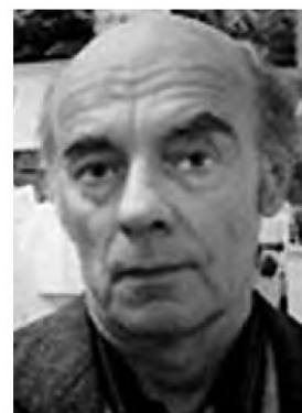
R. Berger /SK