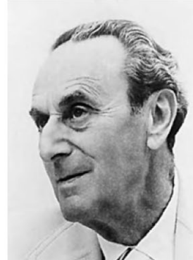
Zipper /A - USA