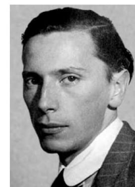
Panufnik /PL - GB