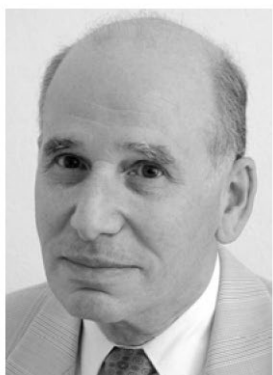
Kolman SK - A