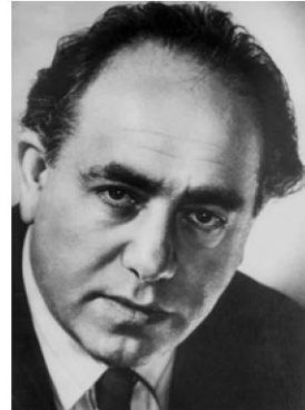
Zeisl /A - USA