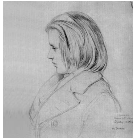
1853: Brahms in Leipzig und Zeichnung (J.-B. Laurens) R. Schumann gewidmet